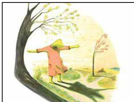
Nour, le moment venu Couverture du livre

Pour toute information, contactez-nous par téléphone au 021 647 45 48 ou par mail. Vous pouvez aussi venir nous voir, on vous offre volontiers quelque chose à boire!!