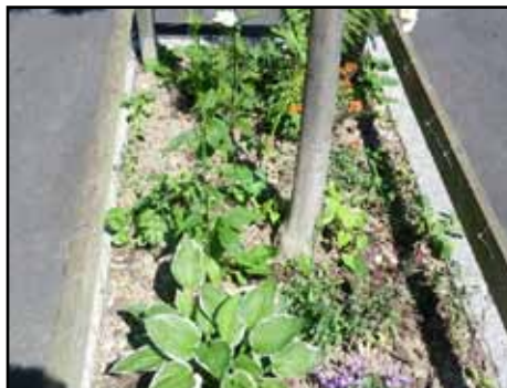
Une des plantations du Collectif Arrêt du bus T-L Vinet

N'hésitez pas à vous promener entre Beaulieu, Vinet, Pré-du-Marché, etc. pour découvrir leur initiative tout en couleurs!