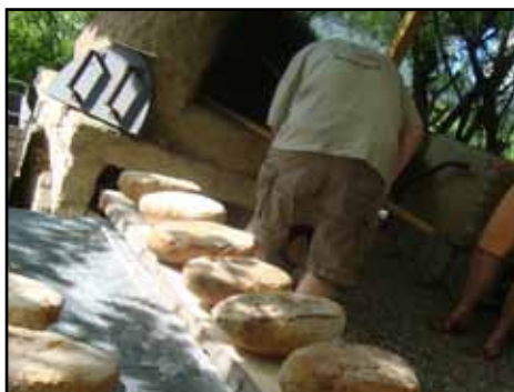
Les samedis du pain au Terrain d'Aventure Cuisson du pain au feu de bois