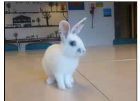
Flocon La mascotte des résidents