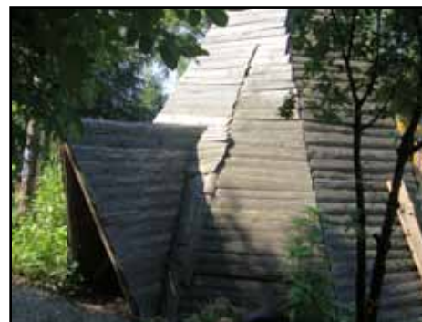
L'entrée du Tipi Terrain d'Aventure